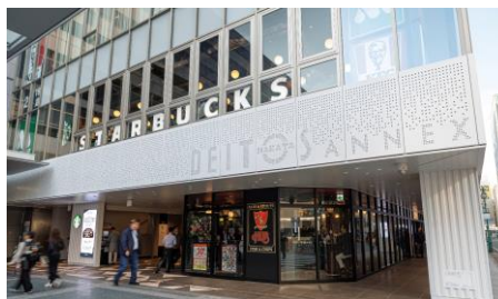
2024年3月13日(水) デイトスアネックス リニューアルオープン