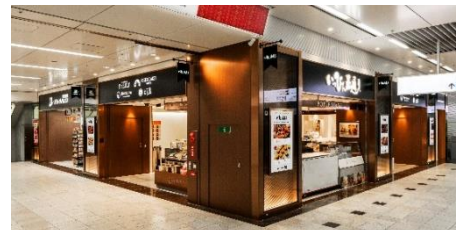
2023年10月6日(金) いっぴん西通り新規開業