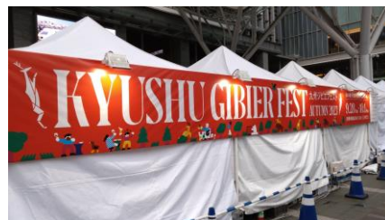
2023年9月28日(木)～ 10月1日(日) 九州ジビエフェスト