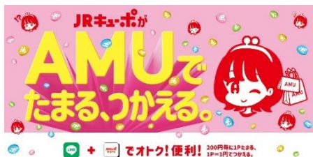
2023年10月4日(水) JRキューポ導入