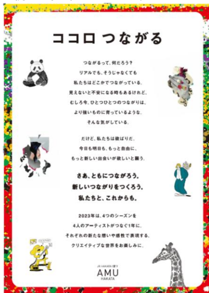
2023年度テーマ「ココロつながる」 メインビジュアル

さらに、2023年10月4日からJR九州が提供するポイントサービス「JRキューポ」がたまる・使えるようになりました。JR博多シティLINE公式アカウントと連携することで限定特典が受けられるなど、各SNSを含めデジタルツールの活用にも継続して取り組んでいます。